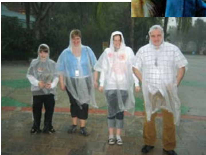
Mikilvægast af öllu, fjölskyldan saman í sól og regni.